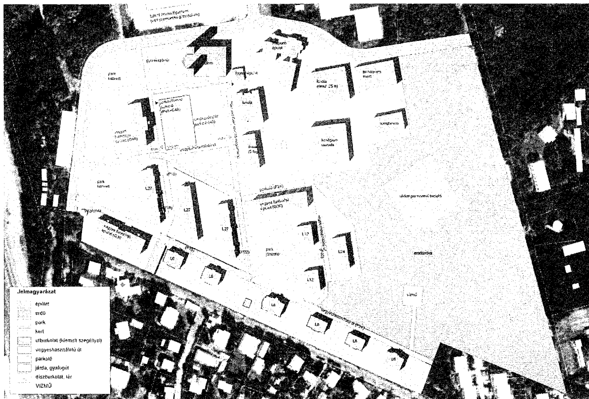
GÖDÖLLŐ PREMONTREI PERJELSÉG TERÜLETE / BEÉPÍTÉSI TERV