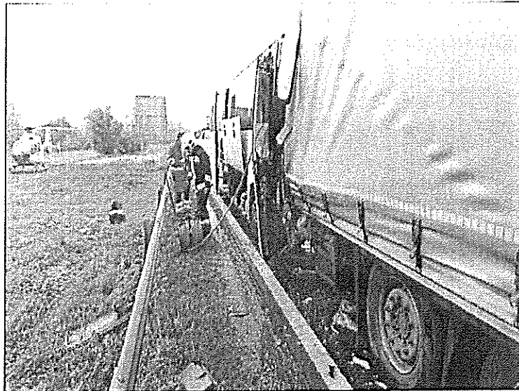
2. számú kép