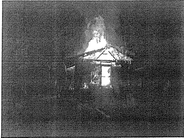
1. számú kép