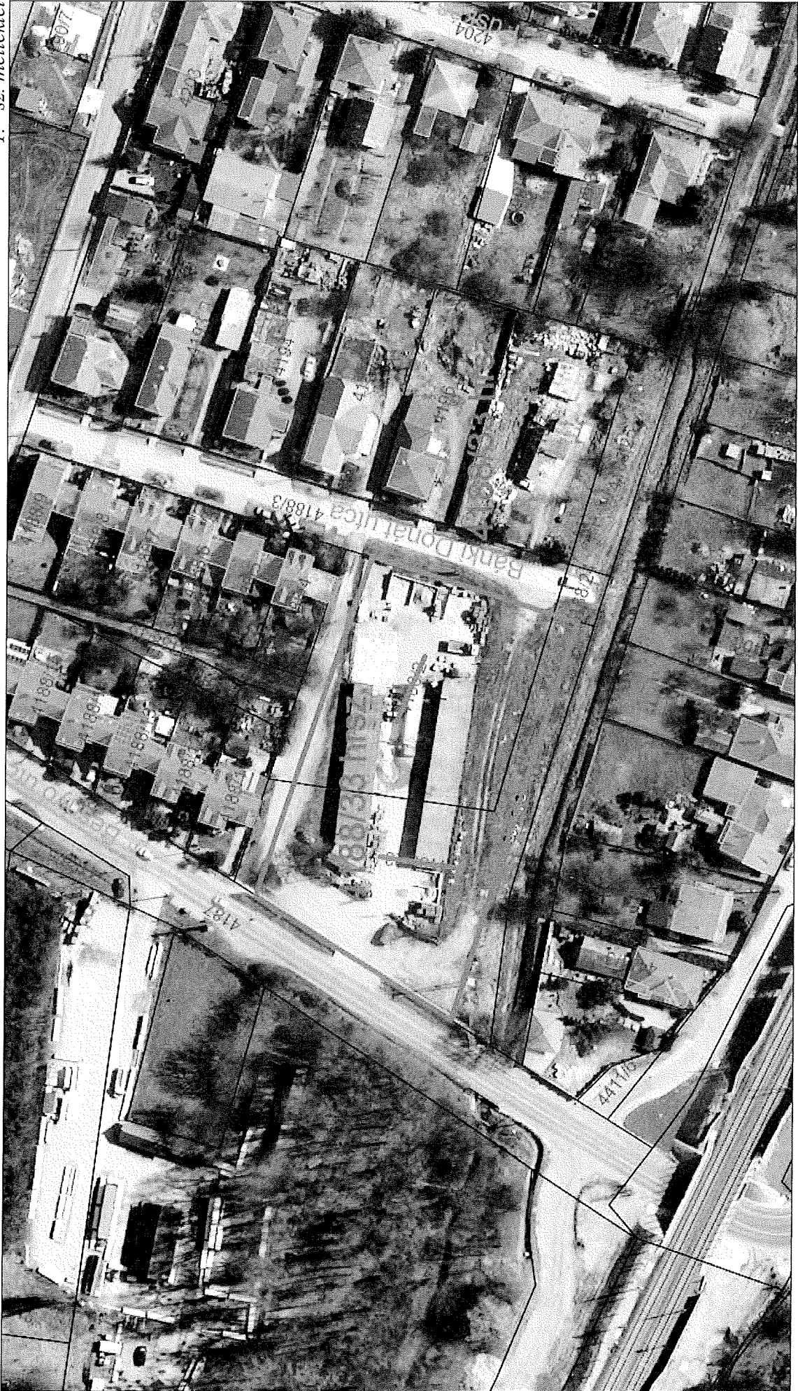
1. sz. melléklet