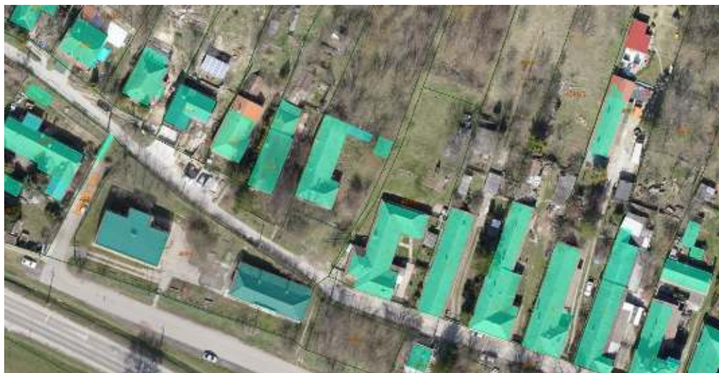
2. ábra: Jelenlegi állapot

A telken felépített lakóépület a környékeliek elmondása szerint paplakként, apácalakásként is funkcionált. Ezért elmondható, hogy Máriabesnyő történetében fontos szerepe lehetett, és máig megőrizte építéskori állapotát, korának funkcionális és építéstechnológiai hagyományait.